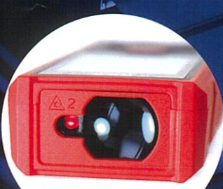
測定距離 50m 赤色レーザー