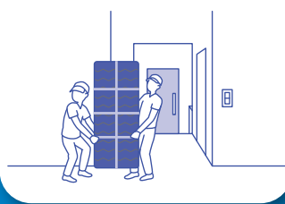
引越しや家具の移動に