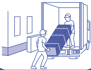
家電製品の搬入・設置作業に