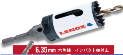
6.35mm 六角軸 インパクト軸対応