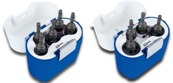
LX90026電気工専用 LX90027配管工専用