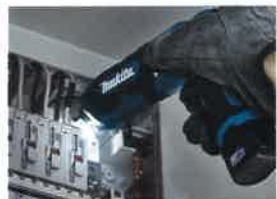
照射範囲を広げ、作業時に周囲も 明るく照らします。