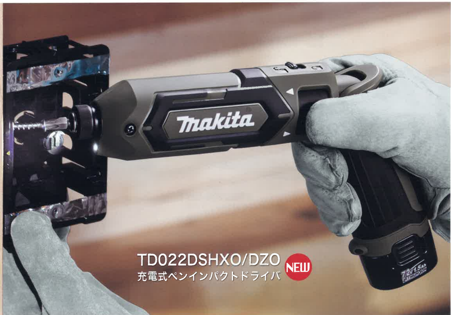
TD022DSHXO/DZO 充電式ペンインパクトドライバ NEW