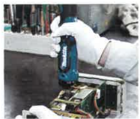
手回しドライバとしても使用可能。