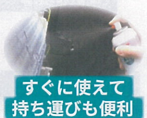
すぐに使えて 持ち運びも便利