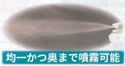
均一かつ奥まで噴霧可能

約 60 種類のカビを含む 2000 種類以上の菌に効果を発揮する 防カビ抗菌剤を使用。 ※1実験室内のデータです。実際の使用条件によって変わります。