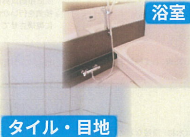
浴室 タイル・目地