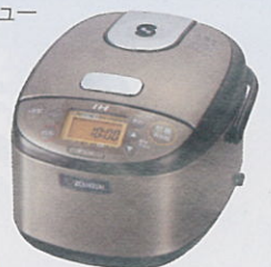
XT ステンレスブラウン