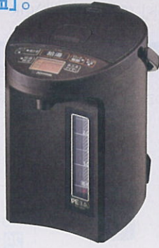
TA ブラウン (写真は3.0Lです。)