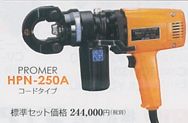
PROMER HPN-250A コードタイプ