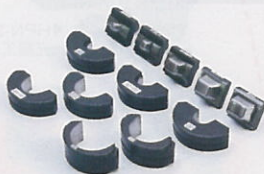
圧着オス・メスダイス