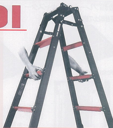
1~4本それぞれに伸縮可能