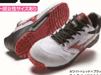
ホワイト×レッド×ブラック C1GA170001