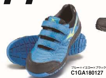
ブルー×イエロー×ブラック C1GA180127