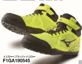
イエロー×ブラック×イエロー F1GA190545