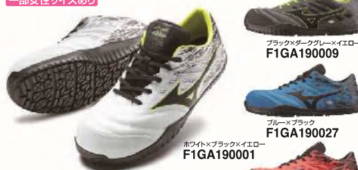
ホワイト×ブラック×イエロー F1GA190001