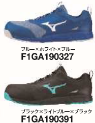
ブルー×ホワイト×ブルー F1GA190327