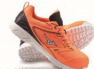
オレンジ×シルバー×ネイビー F1GA180354