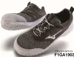
ブラック×ホワイト F1GA190309