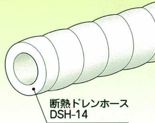
断熱ドレンホース DSH-14

断熱ドレンホース(DSH-14)と 結露防止層付硬質塩化ビニル管(サイズ20)を 直接つなげるジョイントが 新たにラインナップ!